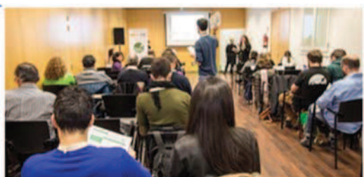
Jornada Conecta Circular (Programa con emprendedores) en Barcelona