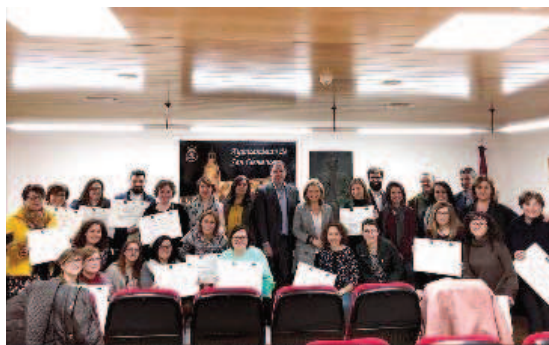
Clausura San Clemente, Autoempleo y Consolidación, Fundación INCYDE, Castilla la Mancha