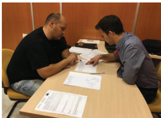
Formación individual, Cámara de Comercio de Almería, Andalucía.