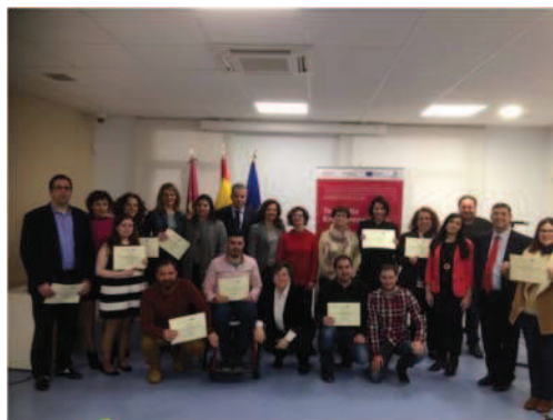
Clausura Team Mix Madridejos, Cámara de Comercio de Toledo, Castilla La Mancha.