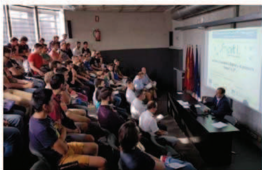
Aplicaciones de Tecnología 4.0 al Sector Industrial: La Realidad de la Industria 4.0, CEEIC, Murcia.